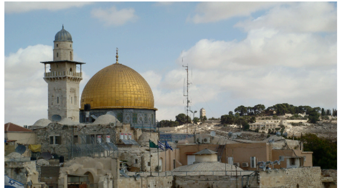
Afbeelding 1: Jeruzalem

Deze internationale campagne om door middel van het planten van olijfbomen samen met Palestijnse boeren de hoop op een goede toekomst levend te houden, is zowel ter plaatse als in Nederland een groot succes. Namens YWCA Nederland zit Geeske Zanen in de stuurgroep. Kristel Letschert, de coördinator van de campagne, werkt vanuit het YWCA kantoor in Utrecht.